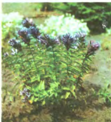
509. Тирлич ваточниковидний.